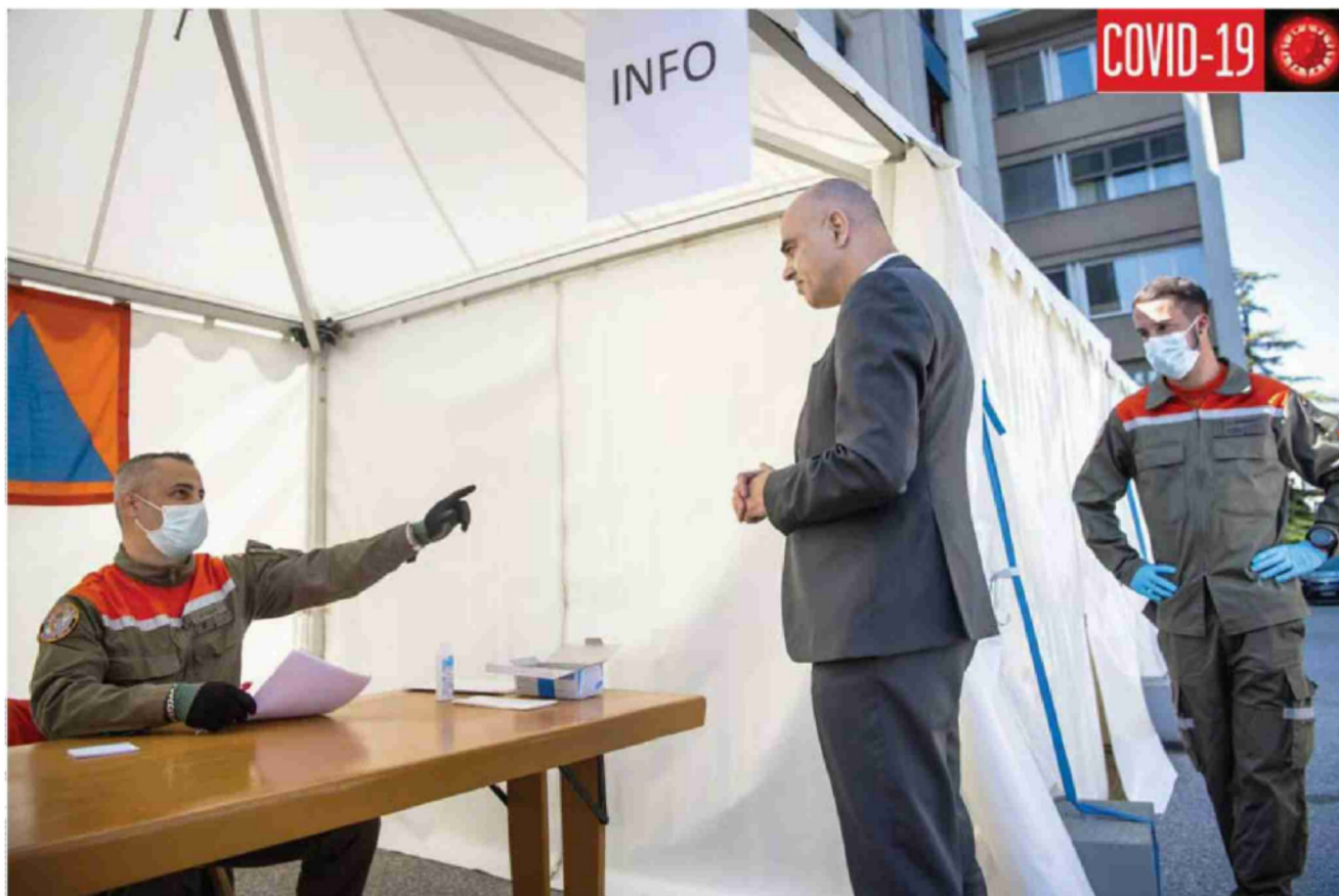
Alain Berset parle avec des membres de la protection civile au CIA, le Centre d'investigation ambulatoire de Sion.